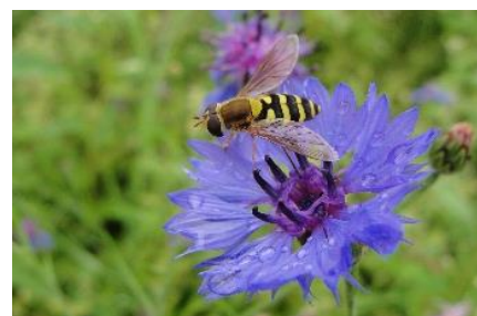
Schwebfliege auf einer Kornblume