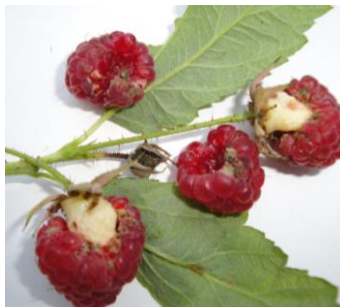
Himbeeren mit Himbeerkäfer-Befall