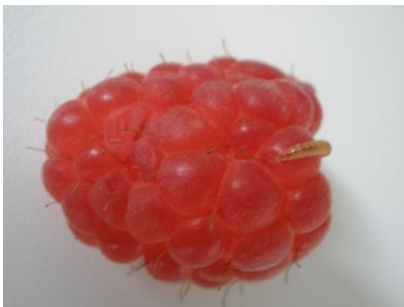
Larve des Himbeerkäfers