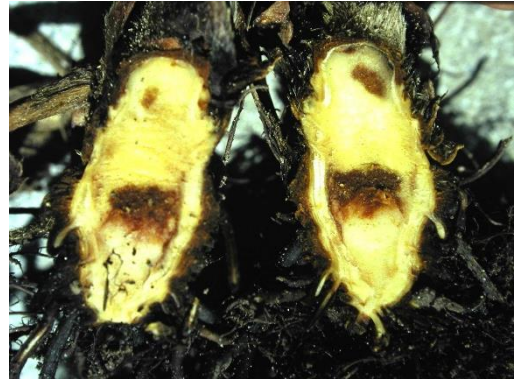
nekrotisch-schwammige Zone im Rhizom

Kurz nach der Pflanzung fängt das Blattwerk an zu welken. Das Welken geht vom Herz aus und führt zum Vertrocknen der Pflanze. Im Inneren weist das Rhizom eine nekrotisch-schwammige und rotbraune Zone auf. Beim Ausreissen der Pflanze bricht sie auf der Höhe des Wurzelhalses. Der Erreger verbreitet sich über Zoosporen. Diese breiten sich aktiv über das Bodenwasser aus und befallen das Rhizom und die Ausläufer. Deswegen fördern Böden mit Staunässe die Ausbreitung der Krankheit. Der Erreger kann mehrere Jahre im Boden überdauern. Vorbeugend sollte Staunässe verhindert und auf Kartoffeln, Leguminosen und Phacelia als Vorkultur verzichtet werden. Befallene Pflanzen entfernen und anfällige Sorten als Topfgrünpflanzen pflanzen. Es ist ratsam, auf Parzellen mit erhöhtem Risiko im Sommer ein geeignetes Fungizid einzusetzen.