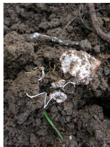
weissliches Myzel auf Wurzel

Befallene Pflanzen sterben langsam ab. Für eine sichere Bestimmung ist eine Laboranalyse erforderlich. Befallene Pflanzen sollten mit Wurzeln und anhaftender Erde entfernt werden. Vor einer Neupflanzung müssen Wurzeln, Teile von Pfählen und Holzschnitzel entfernt werden. Als Vorgängerkulturen sind Reben, Obstbäume, Brombeeren, Heidelbeeren, Erdbeeren und Cassis nicht geeignet. Das Einbringen von Armillaria -befallenen Holz-/Rindenschnitzeln ist unbedingt zu vermeiden