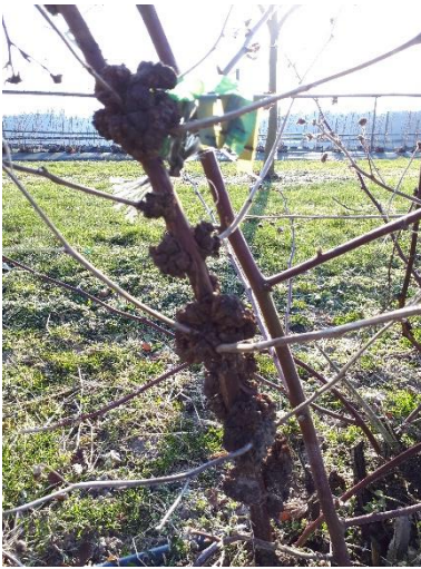
Tumore bei sehr starkem Befall auf oberirdischen Teilen der Pflanze

Auf dem Wurzelhals und den Wurzeln bilden sich Tumore. Diese können faustgross werden. Bei starkem Befall wird die Wuchskraft der Pflanze beeinträchtigt. Das Bakterium kann über Bodenwasser und durch fliessendes Wasser auch über längere Strecken verbreitet werden.