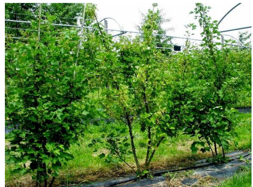
Welken der Blätter an Stachelbeere

Gründungen und Zwischenfrüchte mit Wirtspflanzen des Erregers sollten vermieden werden. Es ist eine Zwischenbegrünung mit schwachem Wurzelwachstum zu wählen. Zudem sollte Stress durch Wasserüberschuss oder -mangel sowie übermässiger Behang und Konkurrenzvegetation um den Stamm vermieden werden.