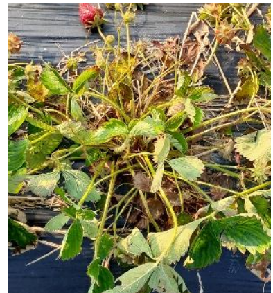
Oberirdische Symptome Schwarze Wurzelfäule

Wurzeln sind dunkelbraun bis schwarz und ohne Feinwurzeln. Während der Zentralzylinder weiss bleibt, lösen sich beim Verreiben der Wurzeln zwischen den Fingern, die äussere Schicht vom Zentralzylinder. Diese Krankheit kann durch mehrere Erreger ausgelöst werden. Zur Bestimmung ist ein Labortest nötig. Die Erreger überleben einige Jahre im Boden. Wartefristen von mindestens 3 Jahren sind einzuhalten. Befallene und gesunde Nachbarpflanzen sollen entfernt werden. Eine Fruchtfolge ohne Nachtschattengewächse und Obstbäumen ist einzuhalten.