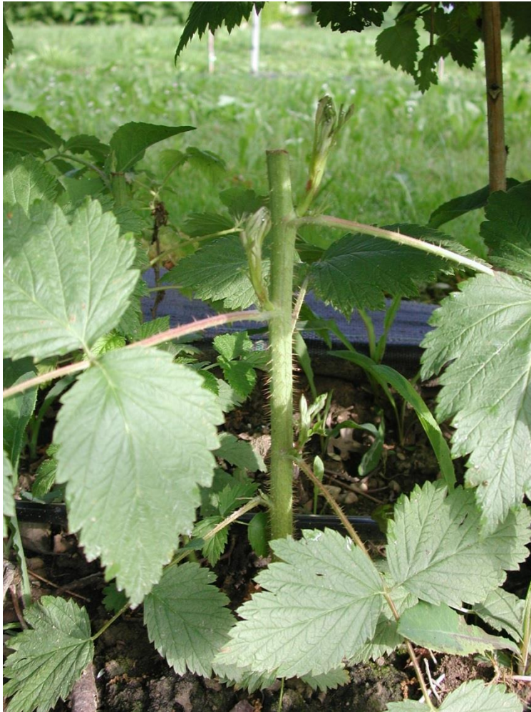
Sommerhimbeeren und Brombeeren - bei wenig Jungruten, pincieren, zur Erhöhung der Rutenanzahl

Bei Sommerhimbeeren werden bis im Herbst mittelstarke Jungruten angestrebt, mit kurzen Internodien und einer Höhe von etwa zwei Metern. Aus diesem Grund können bei genügendem Jungruten-Austrieb die ersten Jungruten bis spätestens zum Erntebeginn der Tragruten entfernt werden. Die danach heranwachsenden Jungtriebe entwickeln sich bis zum Vegetationsschluss im Spätherbst ausreichend. Ist der Austrieb an Jungruten zu gering (z.B. bei Tulameen-Kulturen nach mehreren Standjahren), werden die vorhandenen Jungruten auf etwa drei Knospen pinciert. In der Folge entwickeln sich daraus zwei oder drei mittelstarke Triebe.