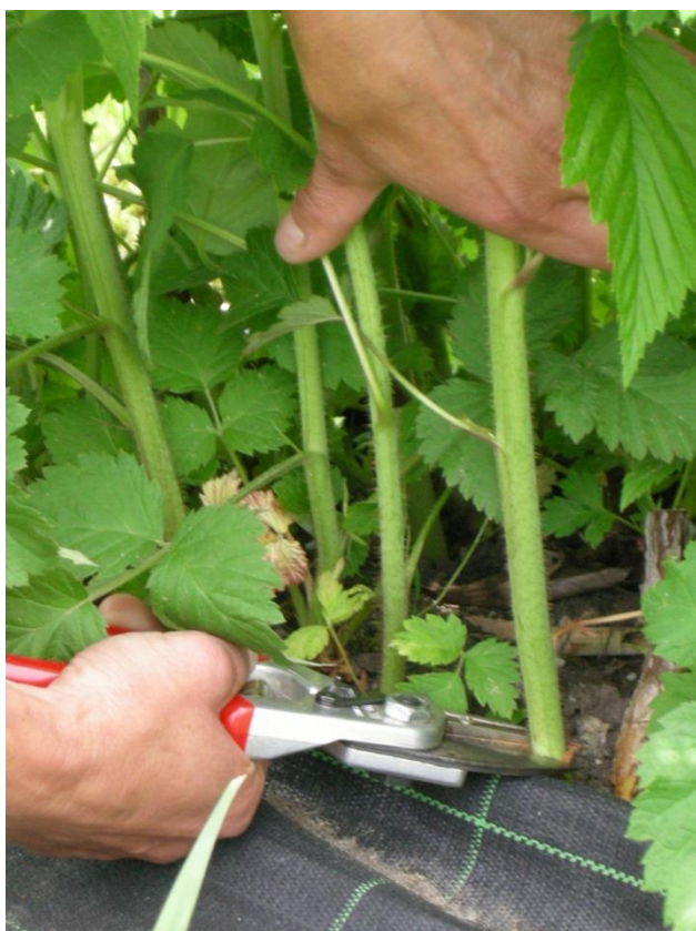
Sommerhimbeeren - Jungruten frühzeitig ausdünnen.