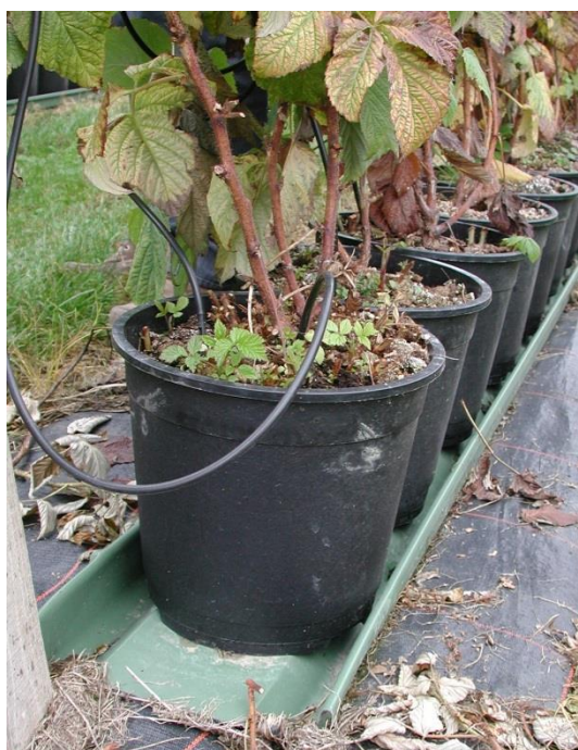
Bei 1-jährigen Sommerhimbeeren im Substrat - alle Jungtriebe entfernen

Bei getopften einjährigen Sommerhimbeeren aus Longcanes sind laufend alle Jungruten zu entfernen, damit die Tragruten nicht von den Jungruten um Wasser und Nährstoffe konkurrenziert werden. Beim einjährigen Anbau werden die Pflanzen nach einer Ernte ersetzt (vgl. einjähriger Erdbeeranbau). Die stehenden Seitennetze sind rechtzeitig zu montieren, damit nicht Seitentriebe mit den Blüten- und Fruchtanlagen verletzt werden.