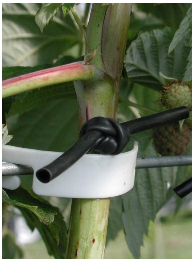
Jungruten laufend aufbinden