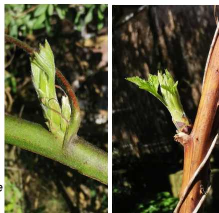
Austrieb Loch Ness und Himbeere am 13.03. im Mittelland (thoh)

Die Strauchbeeren sind meist gut durch den Winter gekommen. Eventuelle Frostschäden bei Himbeeren sind jetzt beim Austrieb zu erkennen. Je nach Standort befinden sich die Kulturen im Stadium Austrieb bis erste Blattentwicklung BBCH07 bzw. BBCH54.