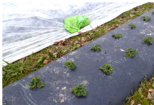
Bild: nach dem Ausputzen können die Frühsorten wieder mit dem Verfrühungsvlies abgedeckt werden

Diese Pflegemassnahme dient dazu, den Krankheits- und Schädlingsdruck im Bestand auf ein Minimum zu senken. Auch das direkt bei der Pflanze wachsende Unkraut wird bei diesem Arbeitsgang beseitigt. Das alte Laub wird am besten aus der Anlage entfernt.