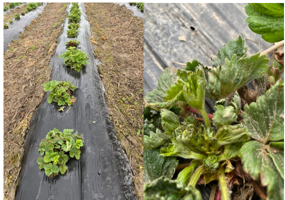
Typisches Schadbild der Weichhautmilbe in einem Erdbeerbestand (kogb)

Bei Befall mit Weichhautmilben kann eine Behandlung mit zugelassenen Akariziden, wie Movento SC (0,1% max.1 Anwendung pro Parzelle und Jahr, nur vor Blüte oder nach Ernte) oder anderen (z. B. Kiron) erfolgen, Spe3-Auflagen beachten! Eine volle Wirkung ist nur bei ausreichend Blattmasse (10-20 cm neue Blätter), aktivem Pflanzenwachstum (ausreichend Wasser) und wüchsiger Witterung zu erwarten. Am besten zwei Behandlungen im Abstand von 14 Tagen durchführen, dabei die Wirkstoffgruppe wechseln.