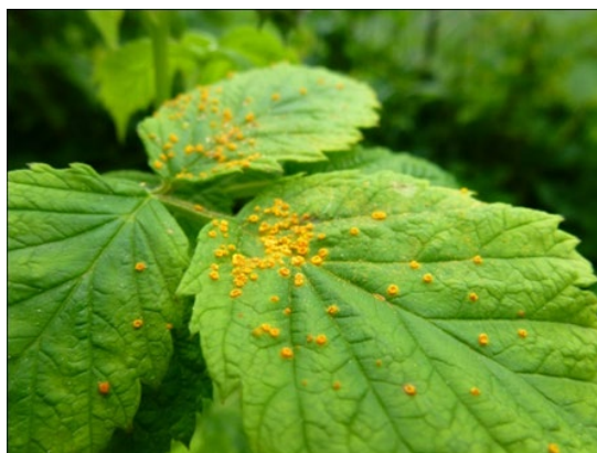
Rostpilz auf dem Himbeerblatt

Die Hauptinfektionsgefahr durch Rost ist im Juni bei warm-feuchter Witterung. Dennoch kann jetzt beim Herausschneiden der Altruten teilweise ein Befall an Jungruten mit Himbeerrost festgestellt werden (orangefarbene Pusteln oben oder schwarze Wintersporen blattunterseits sichtbar). Bei Befall sollten die Jungruten der Sommerhimbeeren mit Flint oder Tega (max. 3x pro Jahr anwenden) behandelt werden. Die Behandlung wirkt zusätzlich gegen Rutenkrankheiten. Vorbeugend zur Befallsminderung auf gute Durchlüftung der Anlagen achten (Bestände ausreichend auslichten). Zudem stehen verschiedene Produkte (Slick, Bogard, SICO etc.) mit dem Wirkstoff Difenoconazol (Spe3 Auflage, nur vor Blüte oder nach Ernte) sowie das Produkt Moon Sensation (max. 2x pro Jahr, Spe3-Gewässerabstandsaufgaben beachten!) gegen Rost zur Verfügung.