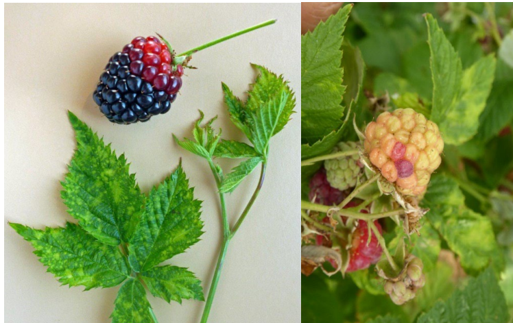
Symptome von Blattmilben auf Brombeere und Himbeere

Ein Befall äussert sich mit mosaikartigen Blattflecken und stark aufgehellten, weissen Fruchtpartien bzw. Einzelbeeren. Ist in dieser Saison ein Befall aufgetreten, ist eine Nacherntebehandlung mit zugelassenen Akariziden empfohlen. Zugelassen für eine Nacherntebehandlung sind Kanemite (Spe3-Auflage, 1 Behandlung/Parzelle und Jahr) und Schwefel. Die Behandlung sollte bis Ende September erfolgen, danach wandern die Milben in die Triebknospen ab zur Überwinterung. Mit einer Akarizidbehandlung im Herbst werden Raubmilben allerdings massiv beeinträchtigt. Ist in dieser Saison kein Befall aufgetreten, besteht die Möglichkeit im Frühjahr bei Austrieb Knospenproben zur Analyse einzusenden, so kann gezielt gegen die Blattmilbe vorgegangen werden und Raubmilben werden geschont. Nehmen Sie dazu mit der kantonalen Fachstelle Kontakt auf.