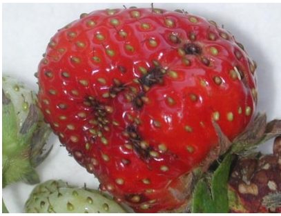
Blattflecken - Fruchtschaden