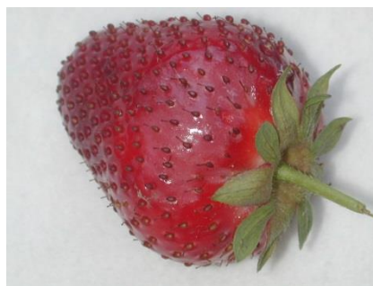
Fruchtschäden durch Sonnenbrand