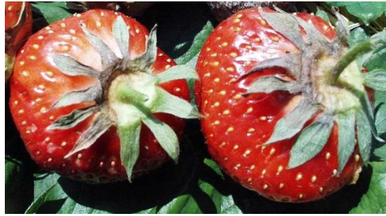
Erdbeeren mit vertrockneten Kelchblättern