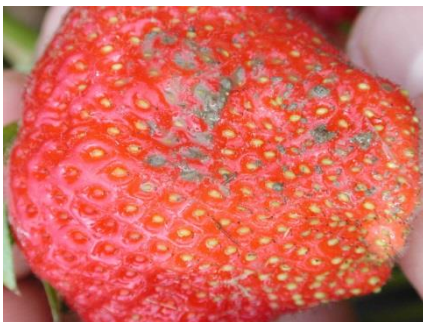
Erdbesatz an Erdbeere