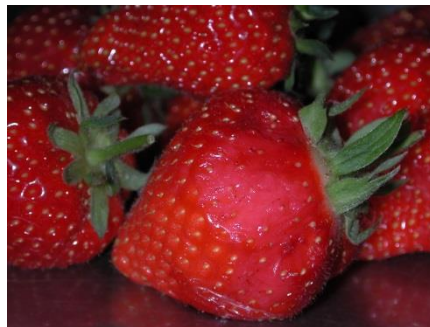
Erdbeere mit Druckstelle