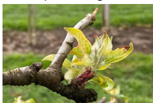
Gala Galaxy (BBCH56) Grünknospenstadium

Phänologie am 30.03.2026, Lindau (ZH, 540 m ü. M.). Die Behandlungsempfehlungen beziehen sich auf die phänologischen Stadien kurz vor Blühbeginn.