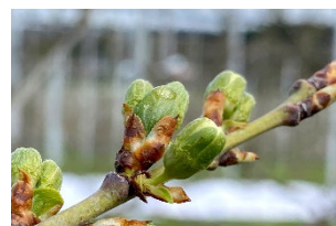
Dabrovice (BBCH57) Kelchblätter geöffnet

Der Frost vom vergangenen Freitag- und Samstagmorgen hat teils zu ersten, aber abgesehen von blühenden Aprikosenanlagen zu verkräftbaren Schäden an Blütenanlagen geführt. Die insgesamt winterlichen Temperaturen der vergangenen Woche haben dabei zu einem Stillstand im Vegetationsfortschritt geführt. Dies wird sich nun schlagartig ändern, denn ab Karfreitag und über das Osterwochenende nehmen die Temperaturen laufend zu und werden ab Ostersonntag bis Anfang der kommenden Woche die 20 °C knacken. Die Obstblüte dürfte also mit grossen Schritten näherrücken.