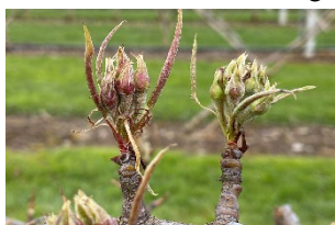
Conférence (BBCH56) Grünknospenstadium