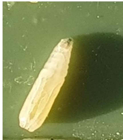
Larve der Mittelmeerfruchtfliege

Nach der Paarung legen die Weibchen durchschnittlich 300 Eier unter die Schale der intakten, reifenden Früchte. Die Eier sind länglich, weiss und werden in Gruppen abgelegt. Die Larven sind im ersten Stadium noch durchsichtig, im zweiten und dritten Stadium weisslich. Am Kopf ist ein schwarzer Mundhaken sichtbar.