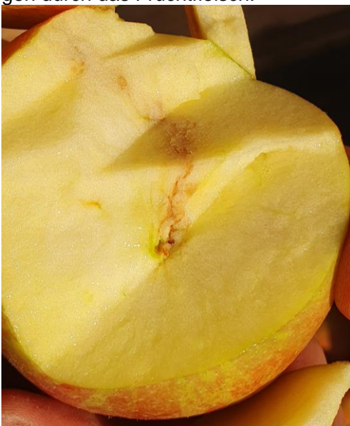
Gänge im inneren des Apfels

Die Larven fressen sich in verworrenen Gängen durch das Fruchtfleisch.