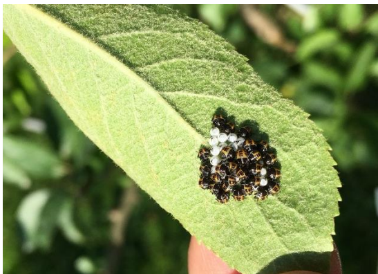
Nymphen von Marmorierten Baumwanzen

Die Zulassung der weiteren in der Allgemeinverfügung aufgeführten Pflanzenschutzmittel ist davon nicht betroffen. Die Pflanzenschutzmittel Audienz (W 6020), BIOHOP AudiENZ (W 6020-1), Elvis (W 6020-2), Bandsen (W 7133), Gesal Käfer- und Raupen-Stop (W 7133-1) und Perfetto (W 7133-2) dürfen für die Bekämpfung von Baum-, Frucht- und Weichwanzen in den in der oben genannten Allgemeinverfügung genannten Kulturen eingesetzt werden.